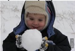
Баланың қолында не